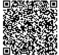
《 申込フォーム 》