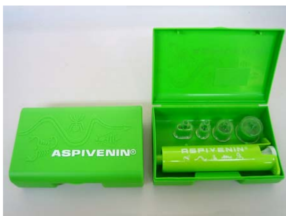
① 咬まれた部位によってパーツが4種類あります。