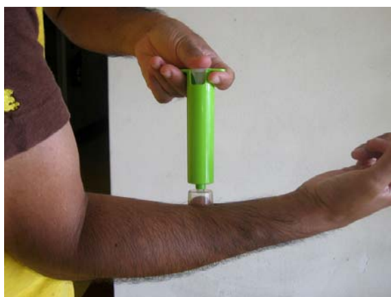
③ 中の棒を最後まで押します