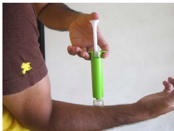
② 吸い取る前の様子